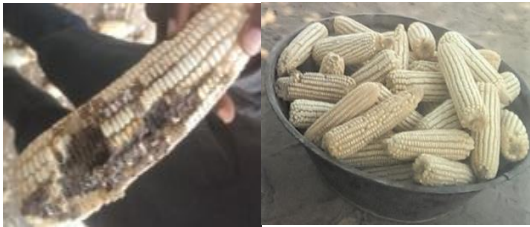
Nsinweta: Ndi Odee Nsinweta: Ndi Odee

Orja nsi ebu (mycotoxins) bu ajo umi (nsi) nke di egwu nke ufodu nje na-emetuta. Mmeru/ofufe orja nsi ebu na otutu nri a na-eri na-eme ka etinye uche nonodu ahuike ebe oka bu otu nke mmeru/ofufe orja nsi ebu kacha emetuta na Najjiria.